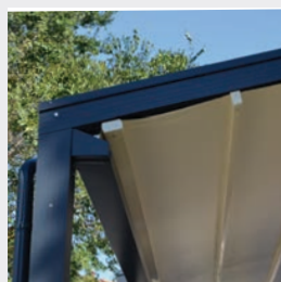
Detalj på stativ.